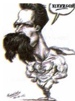
El Superhombre de Nietzsche

Los valores son cualidades y/o propiedades valiosas de las cosas, las actividades, las creaciones de las personas y, sobre todo, de las propias personas, que se ponen de manifiesto mediante la actividad cultural. 3