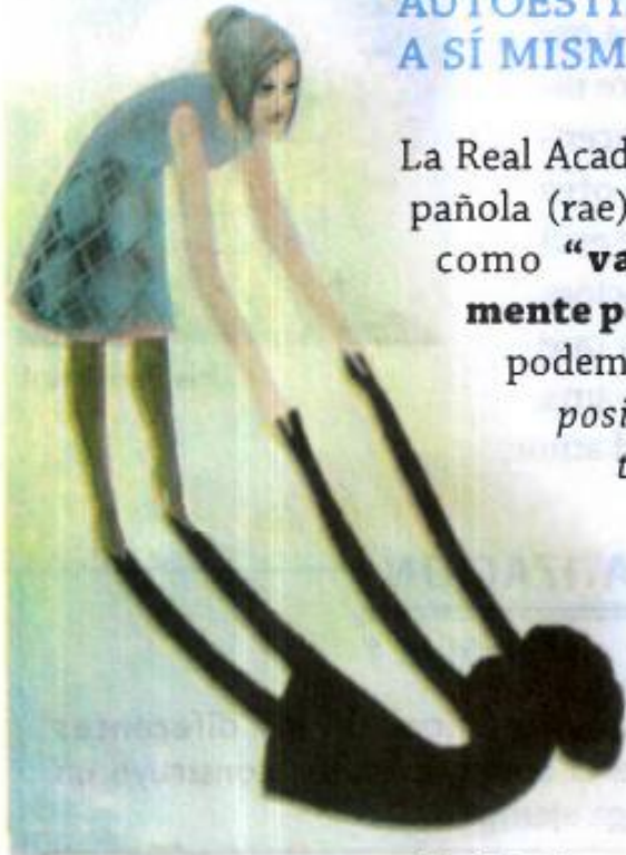
Amor propio como autoestima

La Real Academia de la Lengua Española (rae), define la autoestima como “valoración generalmente positiva de sí mismo” ; podemos decir que implica la posibilidad de aceptarnos tal y como somos , con nuestras virtudes y defectos y que resulta del conocimiento que tenemos de nosotros mismos, es decir, la aceptación de nuestros potenciales y debilidades , aquello de lo que somos capaces de hacer de acuerdo con nuestra humana condición.